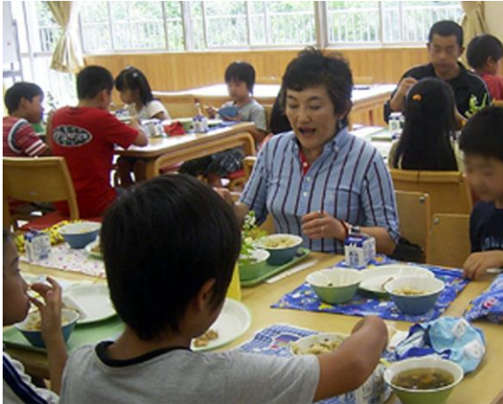
市立長尾小ランチルームにて給食を試食。