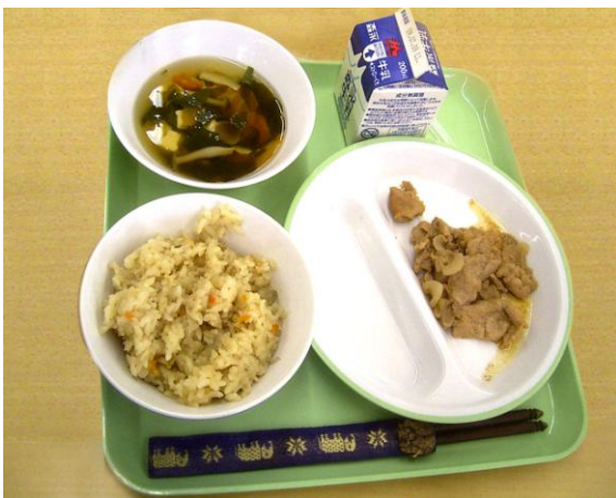
この日の献立。米飯の回数は？

以前視察した学校給食先進市の今治で、特記すべき点は、①学校教育との連携は素晴らしいが、農政主導。学校給食のための契約農家が存在(生産者の生活保障、顔の見える関係) ②有機無