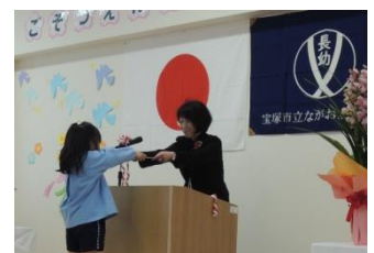
長尾幼稚園卒園式

◆ 私は P T A 会長時代から「CAP」を導入し、議会でも訴えて来ました。現在、いじめや SNS でのトラブルが低年齢化し、いじめ防止活動が急務と、