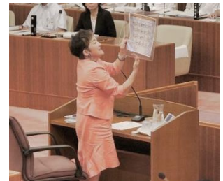
図を示しながらの質問