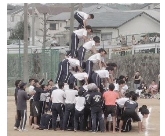
南ひばりガ丘中体育会。

🚫 生徒指導は人格の発達と学校生活の充実をめざす。学習指導は知徳体を育てる。人格形成の両輪