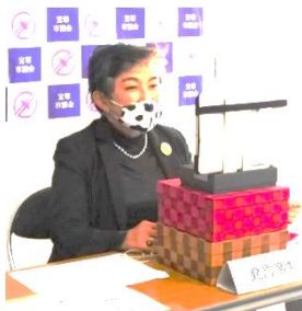
「オンライン議会報告会」リハーサル

議会が何をしているか、市民のみなさんにもっと興味を持ってもらおうと、企画していた矢先のコロナ禍ですが、他市の取組も参考にして私たちも「新しい生活様式」に合わせた議会報告会に挑戦しました。